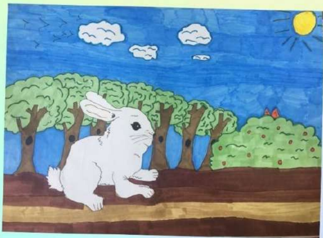
Автор иллюстрации: Кривоченко Диана. Ученица 4 "А" класса.