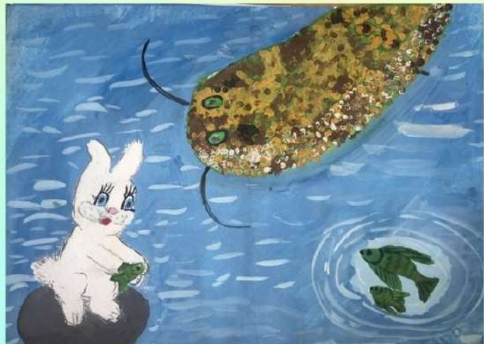
Автор иллюстрации: Щедрина Ксения. Ученица 4 "А" класса.