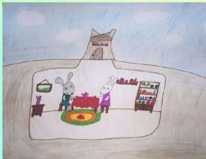
Автор иллюстрации: Артемова Софья. Ученица 4 "А" класса.

Не шумите, не будите, А немного подождите, Пусть детишки подрастут, Всех тогда покажем тут!»