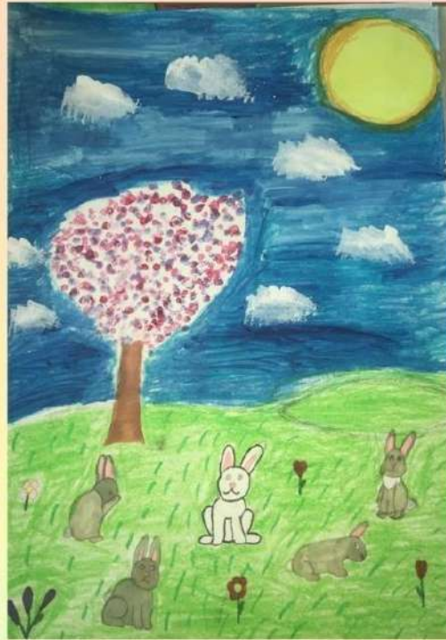
Автор иллюстрации: Найденова Таисия. Ученица 4 "А" класса.

Как же спрятать белый мех, Очень виден он для всех, Бедный, бедный мальчик, Солнечный наш зайчик!