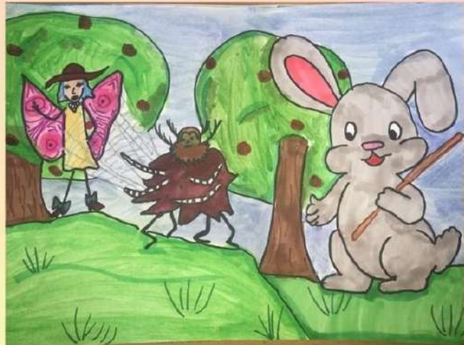
Автор иллюстрации: Санфирова София. Ученица 4 "А" класса.

Зайчик лапкой помахал, И в лесок свой убежал. Вот однажды он в лесу Встретил рыжую лису.