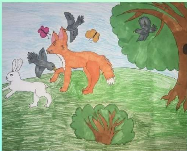
Автор иллюстрации: Кравченко София. Ученица 4 "А" класса.

Бабочки и птицы, Налетели на лисицу, Стали зайца отбивать, И лисицу прогонять!